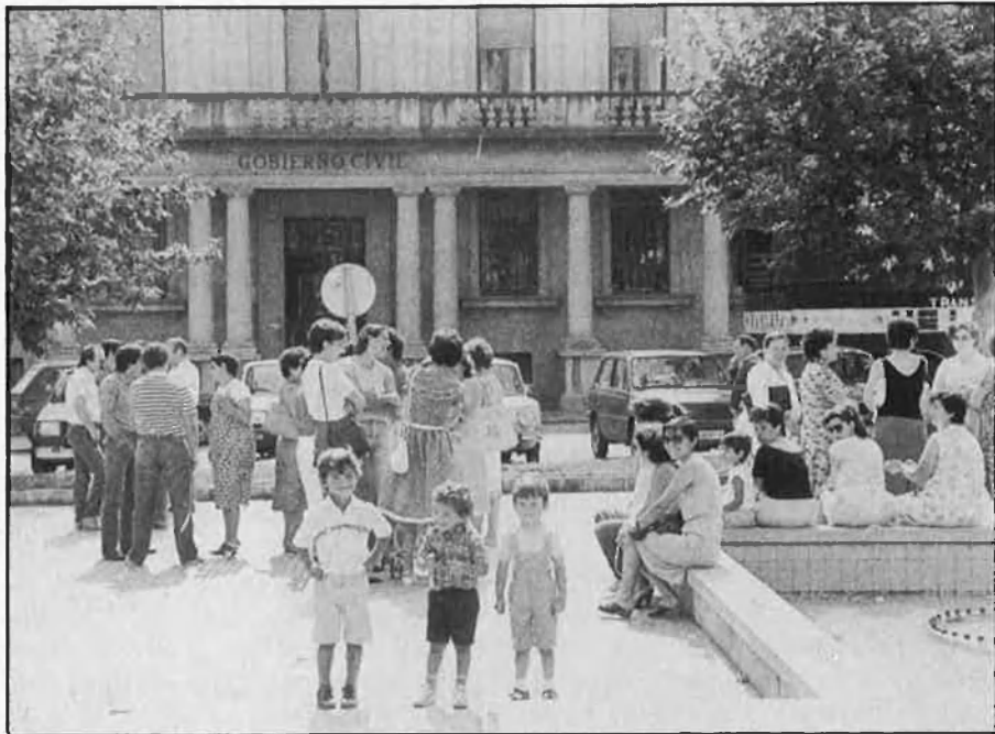
Governos Civils, un planter inesgotable per a captar personalitats i destinar-los després a llocs de confiança.

varro ha declarat que la policia de Catalunya és la policia nacional i la guàrdia civil, i ni tan sols es recorda d'esmentar la policia autonòmica. Mentrestant, l'any 1987, a la seva província, Girona, dels quinze homicidis ocorreguts només n'hi ha un de resolt.