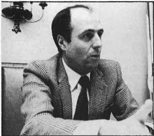
Eugeni Burriel, delegat del govern al País Valencià.

gicament molt útil. El seu nomenament i cessament no han de passar cap filtre, ni s'exigeix cap condició específica, ni han de ser funcionaris, ni tenen terminis de mandat, ni res. Són estrictament homes de confiança del ministre de l'Interior i la seva gestió no està sotmesa a cap mena de control local o estatal. I al mateix temps conserven moltes i importants competències. Segons el seu Estatut (Reial Decret de 2 de març de 1981), han de vetllar per l'exercici dels drets i llibertats constitucionals, garantir els principis de legalitat i de seguretat jurídica, mantenir l'ordre públic i protegir les persones i els béns. Té —¡atenció!— poder sancionador i és el cap de totes les forces de seguretat de l'estat a la província. No cal dir que arreu del món qui mana la policia té la paella pel mànec, sobretot en un país amb problemes greus d'ordre públic i amb períodes de lleis excepcionals. Darrerament, a més, els governadors civils han assumit la direcció provincial de Protecció Civil, un servei també cada vegada més essencial per a la societat espanyola.