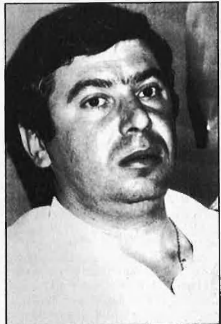
José Luis Corcuera, ministre d'Interior.

sola autoritat, el capità general i l'audiència. Felip V no destruï l'existència de Catalunya com a territori diferenciats dels altres, ho va fer la divisió provincial de 1833. A partir de llavors els territoris històrics desaparegueren inclús com a fórmula administrativa i esdevingueren simples referències al passat. En els papers oficials el mot Catalunya ja no havia d'aparèixer per res, si no era amb aquest caire històric. Cada governador despatxava directament amb Madrid sense haver de tenir en compte els interessos comuns amb les províncies veïnes, sobretot