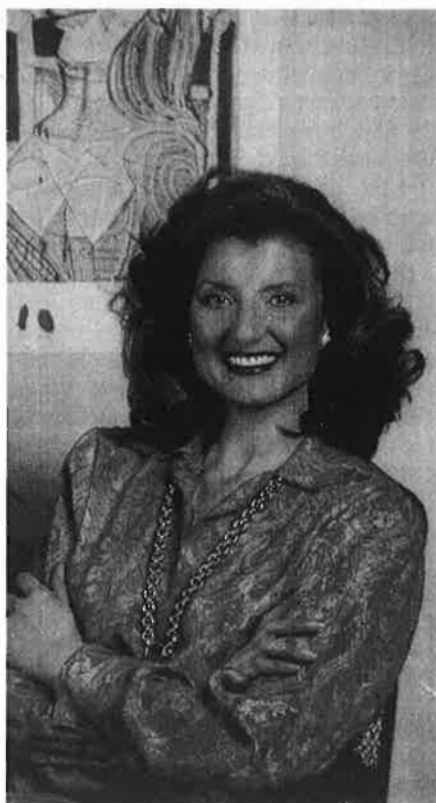
Ariana Stassinopoulos ja havia fet altres incursions en el gènere de les biografies escàndol.

creativa per a projectar-se una altra vida i un nom nou. El nom més nou era Olivier; amb el nom de Fernande Olivier entrà en la vida de Picasso, fou la primera que realment estimà i la que el conduí a la vida adulta.