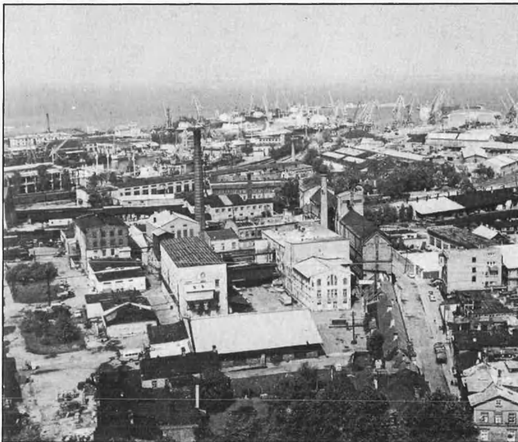
Vista de Tallinn, capital de la república d'Estònia, i del port.

El 61 per cent de la indústria estoniana està subordinada als grans coscos de la Unió, i al Nord-Est d'Estònia, aquesta xifra excedeix el 80,