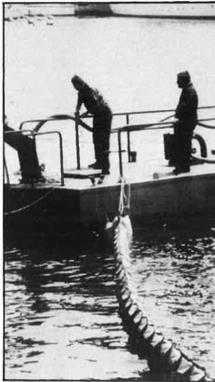
Dos obrers netegen de residus la badia de Tallinn, al Bàltic.

Segons el professor Loit Reintam, la mitjana del preu per a terrenys, a Estònia, és de 53.750 rubles per hectàrea a la regió de Rakvere, que fa un total de 63 bilions de rubles. El preu real és de 6,8 bilions de rubles. Si el Ministeri de la Unió per a fertilitzants mine-