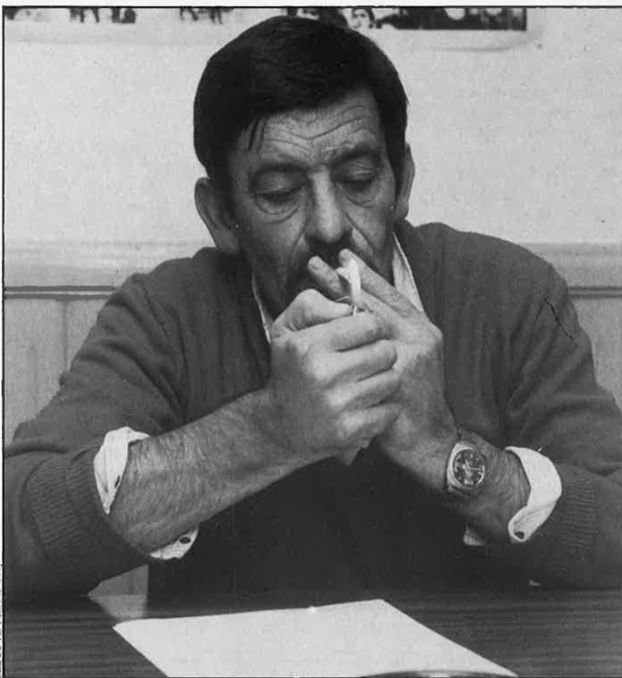
«Abans del 92 el govern haurà solucionat el problema de la violència a Euskadi».

La qüestió és fer, una vegada per totes, un diagnòstic correcte perquè no continuem igual 50 anys més i no ens tanquem més dient que la Constitució ja està establerta i que l'Estatut va ser avalat per la majoria d'aquest poble,