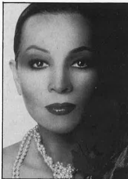
Sara Montiel, també està pel 2000.