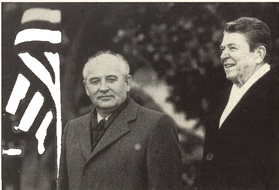
La política d'acostament de Gorbtxov ha ajudat a resoldre el conflicte olímpic.

cipar-hi. Amb ella estigueren la majoria dels països socialistes encara que, sorprenentment, hi va acudir Romania, la qual cosa va significar el primer trencament de l'Est d'Europa, encara que en l'àmbit esportiu. Seül es convertí en un problema quan els coreans del Nord van fer una interpretació sui generis de la carta olímpica. Els jocs olímpics es concedeixen a ciutats i no a països.