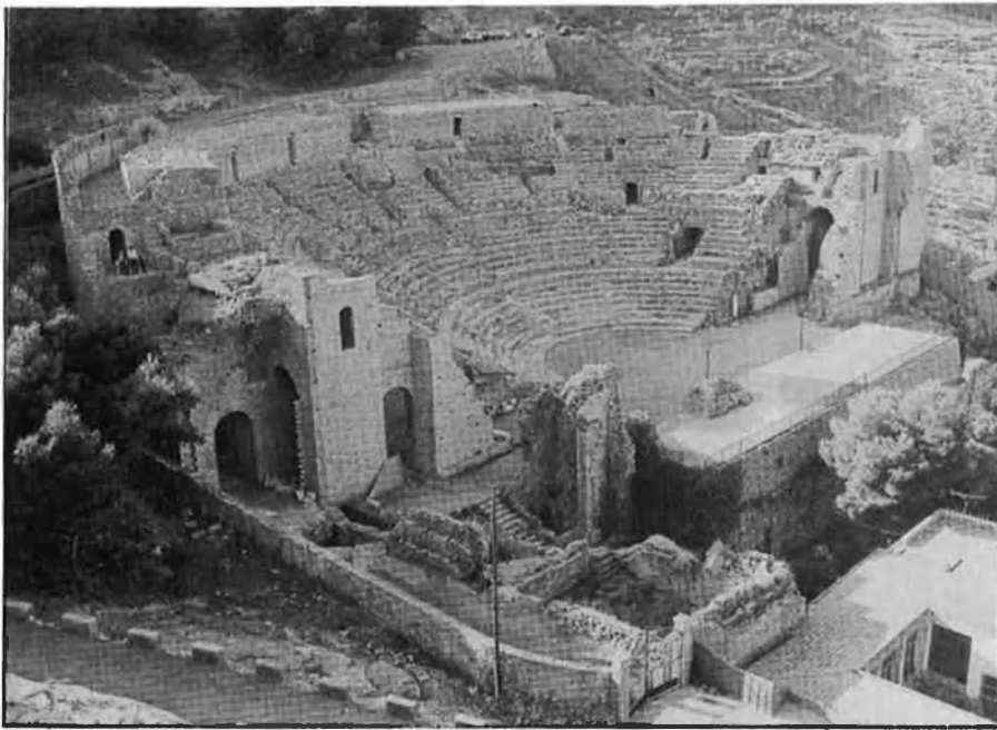
¿Conservar o restituir? Aquesta és la qüestió.

te: «la por a no posseir un major control del teatre, que té algun grup de l'ajuntament, en concret la Fundació Municipal de Cultura. Actualment s'asseguren uns ingressos extraordinaris amb una sèrie d'espectacles que programen, fora del Sagunt a escena, aprofitant que la gestió no està normalitzada». I en aquest sentit, creu que s'han manipulat els sentiments del poble, els signes d'identitat i que es tracta la qüestió de manera molt visceral.