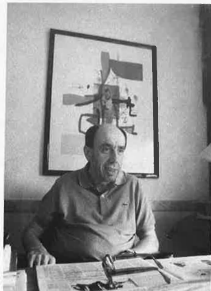
«Jo em vaig sentir sempre en un món a part».

—Em sembla que no, o molt poc, fora d'un cercle de gent coneguda meua o amb aficions semblants. Darrerament se'm coneix més, sobretot a partir de dos moments: jo conec en Jordi Pujol de fa vint anys, aleshores havíem fet alguna cosa més o menys junts, som