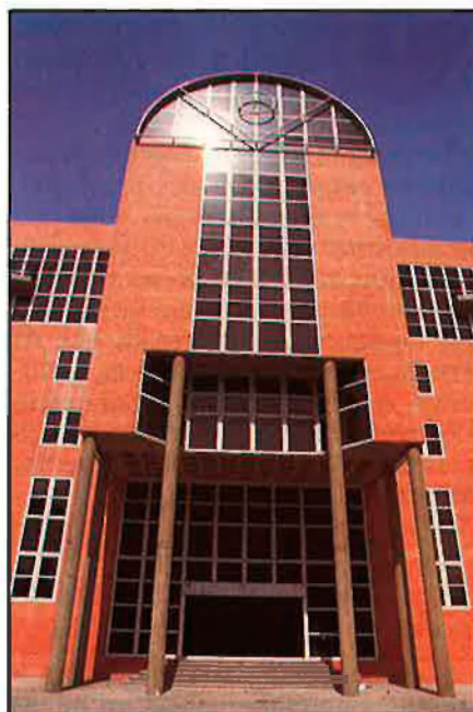
L'administració contracta el 40% dels serveis de neteja empresarial.

En la bugaderia industrial —segons dades de l'Institut Técnico Espanol— hi ha bugaderies amb inversions de fins a 700 milions de pessetes. Segons la mateixa font, una bugaderia de caràcter industrial no resulta rendible si no es realitza una inversió en maquinària superior als 100 milions de pessetes. Aproximadament, el 75% dels equips