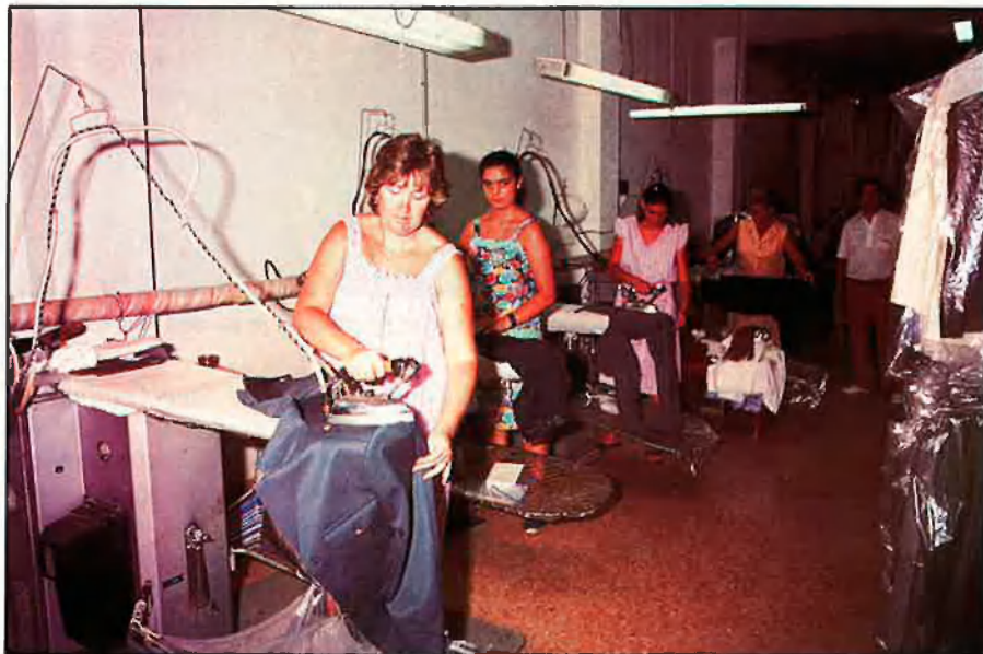
El subsector de bugaderia industrial es compon de 2.000 establiments.

Dins de la denominada activitat de neteja, hi ha integrats dos grans sectors: la neteja industrial i d'edificis i la bugaderia i tintoreria, el nombre real de treballadors oscil·la entre 200.000 i