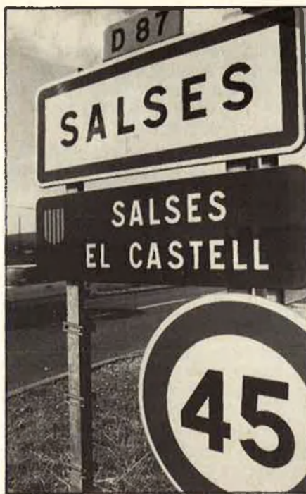
A Salses també parlen com volen.

En direcció a Girona, la vegetació respira entre colors de plata i la dispersió de masos. Han començat a aparèixer escultures a la nostra dreta, per deferència de l'A-7. Absurdes imitacions d'Alfaro. Passarem pel costat de Girona, apuntalada pels contraforts de les Gavarres i la serra dels Àngels, d'on s'alimenta l'interès industrial. Tornen els terrenys argilosos i la vegetació, i notem la pressió en les orelles quan entrem a l'Empordà. Abans, hem circulat sobre el Ter, que feia un camí un poc paral·lel a nosaltres, i ara passem per damunt del Fluvià. En un primer pla, Figueres, i al fons, els Pirineus. Paga la pena, a Figueres, anar a veure els deliris de Dalí. Vinyes, fruites, ramaderies. Avancem cap a la Jonquera i comencen els primers anuncis en francès. A la Jonquera, a la falda pirenaica, els de l'autopista han posat: «Porta Catalana». I Catalunya continua. Fem l'ascensió, i pels costats hi ha carraquetes com bonsais. Una fortalesa militar i els Límits.