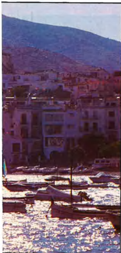
Cadaqués continua sent la resposta més versemblant per al viatger mitòman a la recerca de l'antiga Costa Brava.

Picasso, Bunuel, García Lorca, Eluard, Max Ernst, Magritte, Duchamp, Man Ray, John Cage, Merce Cunningham... han afegit a Cadaqués, amb les seves estades i les seves lloances, el prestigi que ja autors i artistes catalans des de començaments de segle fins ara mateix —senyors: el bo i el millor de cada casa— li havien conreat amb tot mereixement. D'aquests últims, millor no dir-ne noms: són la plana major de l'art i la creació catalana contemporània. I la menor també, i potser l'ínfima. ¿És que es pot tenir pretensions d'artista sense haver passat mai una temporada a Cadaqués? Però tenir-hi casa, o si més no comptar-hi sempre amb una porta oberta, ja és símptoma segur d'èxit, un d'aquests