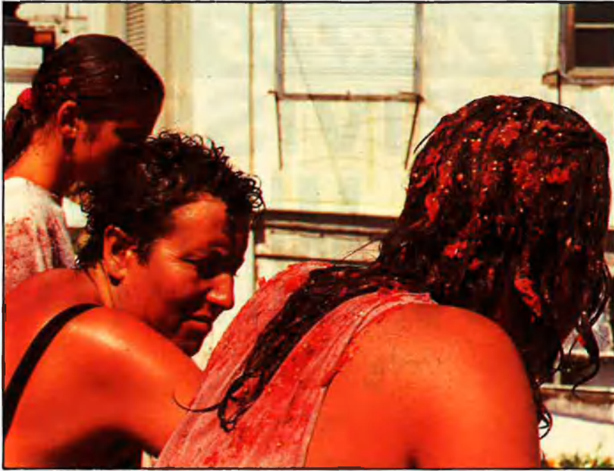
Tots contra tots, a grapats, a puntellons, com es pot. Una sagnia de coàguls de tomaca, de «western» d'Almeria. Una hemorràgia extraordinària.