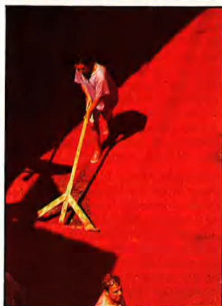
VICENT A. JIMÉNEZ

circumstància, el veïnat, amb una indumentària que mai més no farà servir, es dona cita al carrer del Cid. Allà, des de les 10 a les 11 i, sempre, un poquet, en què s'inaugurarà la batalla, hi ha unes quantes distraccions agropequàries: un tronc considerable amb un pernil al cim i distribució d'aigua des d'una boca de reg. Amb el pernil, la joventut pot fer-se amb una certa glòria municipal. Amb l'aigua, els funcionaris de l'ajuntament pacifiquen l'epidermis enfeltrida d'alcohol del personal. Això els descansa la carn i vociferen eslògans calcats del futbol.