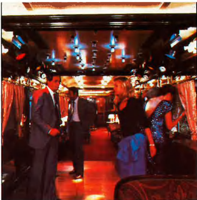
Al-Andalus expreso, un dels trens més luxosos que presten encara servei a l'estat.