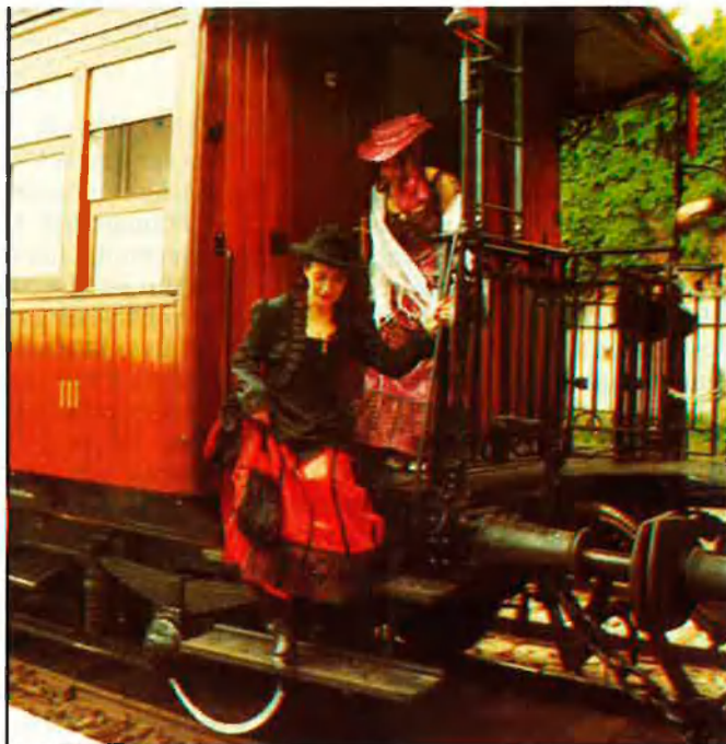
El Tren de la Fresa fa el recorregut Madrid-Aranjuez, inclou en el preu la visita als jardins i palaus d'aquesta última ciutat.

tren de la Fresa, locomotora a vapor que va a Aranjuez i que inclou en el preu la visita als jardins i palaus d'aquesta ciutat. També hi podreu agafar el Murallas de Ávila, Doncel de Sigüenza, Ciudad Encantada, Plaza Mayor, etc. El luxe va a càrrec de l'Al-Andalus, tren turístic amb un acurat servei de visites i menjars. Per desgràcia, és poc assequible per a moltes butxaques, tot i que hi ha opcions des de 35.000 ptes.