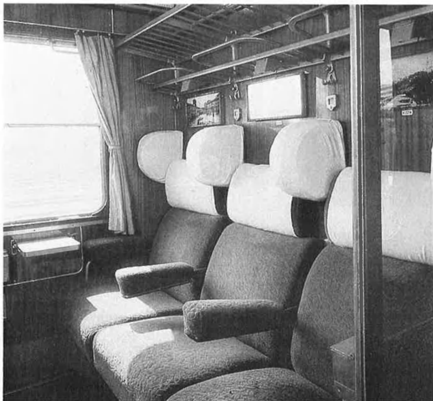
El tren blau, entre París i Niça, i el Golden Arrow, entre París i Londres, encara que tenen la categoria de trens de luxe no estan considerats com turístics.

Amb l'avió, a Londres, després a Vancouver i a Banff. Des d'ací, el tren us portarà durant dos dies, a través de les praderes de les terres baixes fins a Toronto, on visitareu les catarates del Niàgara, per a continuar després cap a Ottawa, Montreal i d'ací a Londres amb l'avió. Podreu trobar eixides cada setmana i hi ha la possibilitat de prolongar l'estada en les ciutats visitades. El preu aproximadament de 260.000 ptes. □