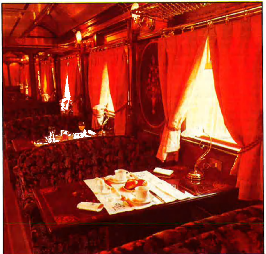
Tren turístic Murallas de Ávila.