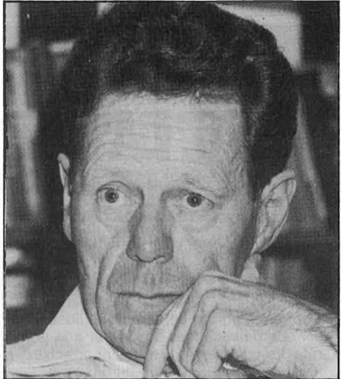
Fernando Sebastián i Hans Küng han participat en edicions anteriors.

La reunió fou franca i cordial i en realitat va servir per a saber que allò que realment preocupa als bisbes és que una associació de teòlegs tinga reconeixement civil i no canònic; és a dir, que els bisbes no puguin manar d'ella. Fernando Sebastián els demanà que donaren els passos pertinents per a obtenir el reconeixement canònic. No tots els membres de l'associació n'estan d'acord i s'ha produït una certa divisió.