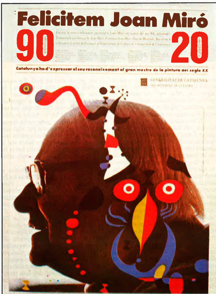
Cartell commemoratiu del noranta aniversari de Joan Miró.