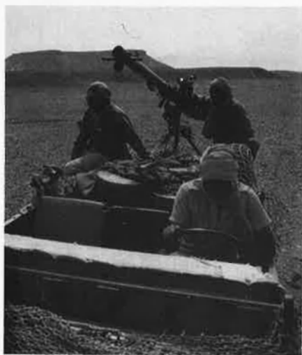
Patrulla del Front Polisario.

la fórmula per a dur-lo a la pràctica. De moment, les dues parts coincideixen que la pregunta a plantejar ha de ser terminant: o l'autodeterminació o la plena integració en Marroc. La carta que Hassan pot tenir amagada passa per oferir un sistema federal que inclouria una àmplia autonomia sahariana a canvi del reconeixement del manteniment de la dependència de Rabat.