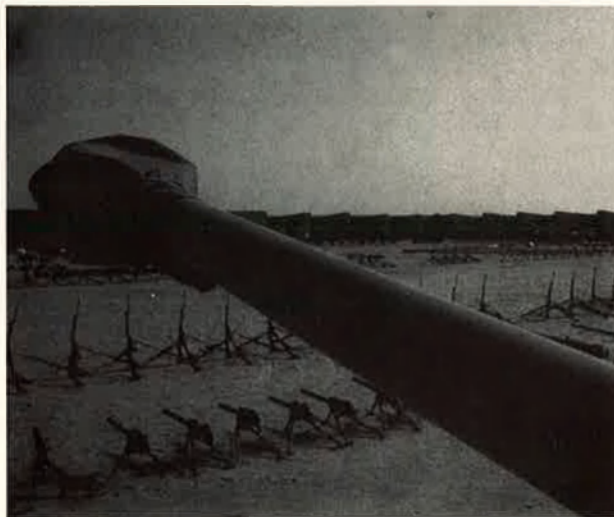
La major part del material de guerra capturat pel Front Polisario al Marroc és de fabricació nord-americana.

situació. D'una banda, el Sàhara Occidental és avui un territori ocupat majoritàriament pel Marroc en què el monarca alauita ha sabut consolidar un ciclopi sistema defensiu amb sofisticada tecnologia americana que li costa 2,5 milions de dòlars diaris de manteniment. El resultat d'aquesta estratègia ha estat l'arraconament militar de les tropes del Front Polisario. Altrament, la República Àrab Sahariana Democràtica (RASD) ha sabut guanyar