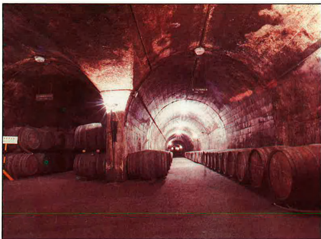
Aspecte interior dels cellers.