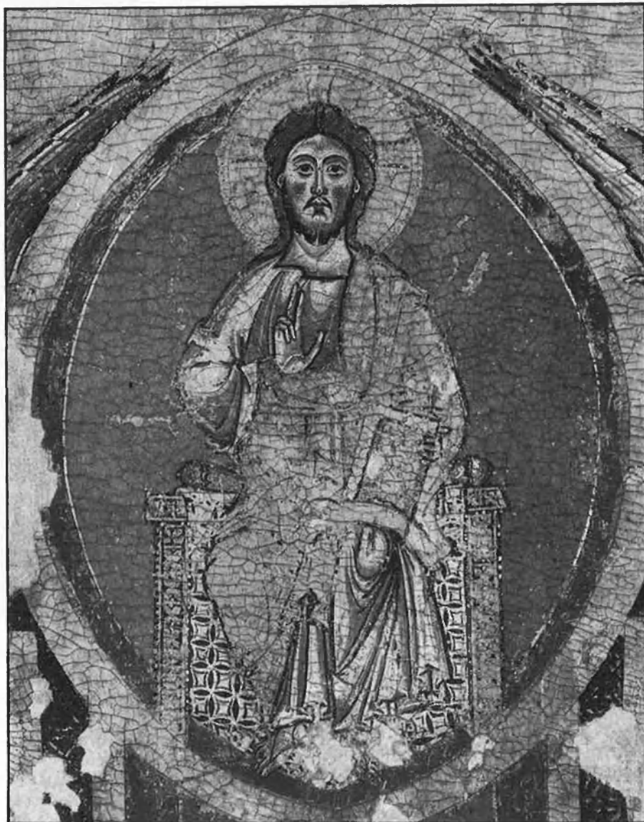
Les heretgies ocupen una part important dins del món literari d'Umberto Eco.

L'estratègia d'Umberto Eco durant els últims anys havia estat perfecta. Ben bé sap ell que l'expectació es crea amb xafardejos continus, si és possible contradictoris. Així, l'autor italià sorprenia a tots dient que estava escri-