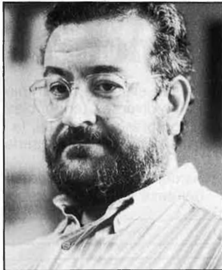
«No sé si la política interessa gaire als valencians».

—Jo crec que el problema és que ací no hi havia —ni n'hi ha— una premsa amb la força que té a Barcelona, per