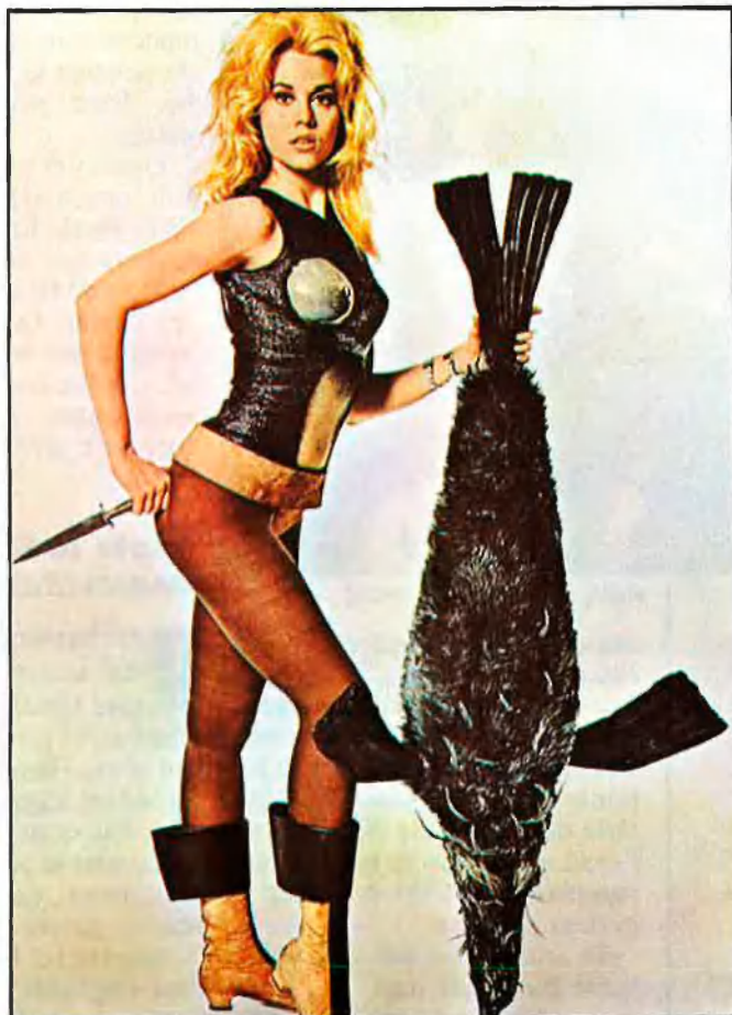
Jane Fonda, com a Barbarella, va il·lustrar prou bé els somnis futuristes.