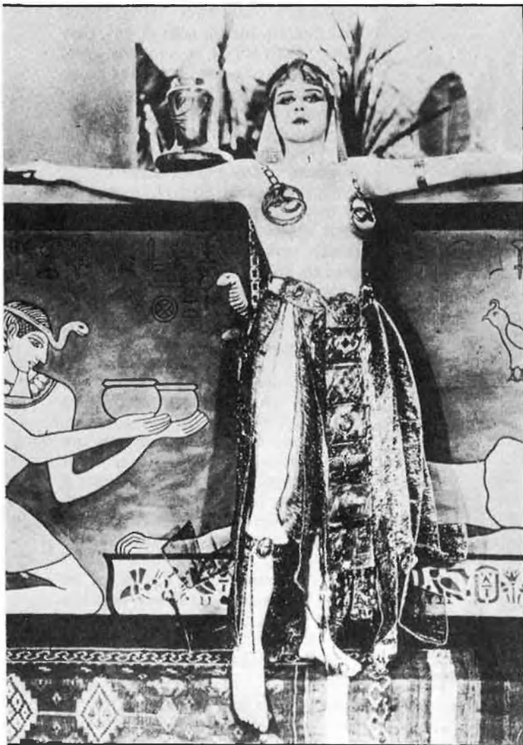
Theda Bara, una de les primeres a demostrar que el sexe podia no ser d'aquest món.

çament. Som a l'any 2069, el gènere masculí, motiu de tots els mals que han afectat la humanitat, està considerat la cosa més nefasta de l'univers. Només hi ha uns pocs exemplars d'homes, els necessaris per a la continuïtat, a través de la inseminació artificial, de l'espècie, confinats a un llunyà planeta. Ginger, April i Jill, tres exemplars d'aquesta nova dona, es dirigeixen amb la nova nau espacial a un astre anomenat Oz, tot xerrant i comentant el fàstic que els faria tenir relacions sexuals amb un mascle.