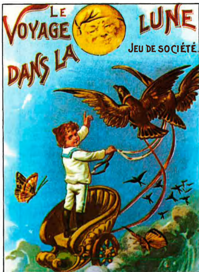
Les ballarines del Follies-Bergère parisenc van ser immortalitzades per Méliès en Le Voyage Dans La Lune (1902).

O en, tota una temàtica, els viatges que alguns astronautes del nostre planeta realitzen a altres mons poblats exclusivament per noies boniques i abillades amb uniformes un pèl atrevits. Com ara els que ofereixen Abbott and Costello go to Mars (Charles Lamont, 1953), una de les millors aventures del duet de còmics, Cat women of the