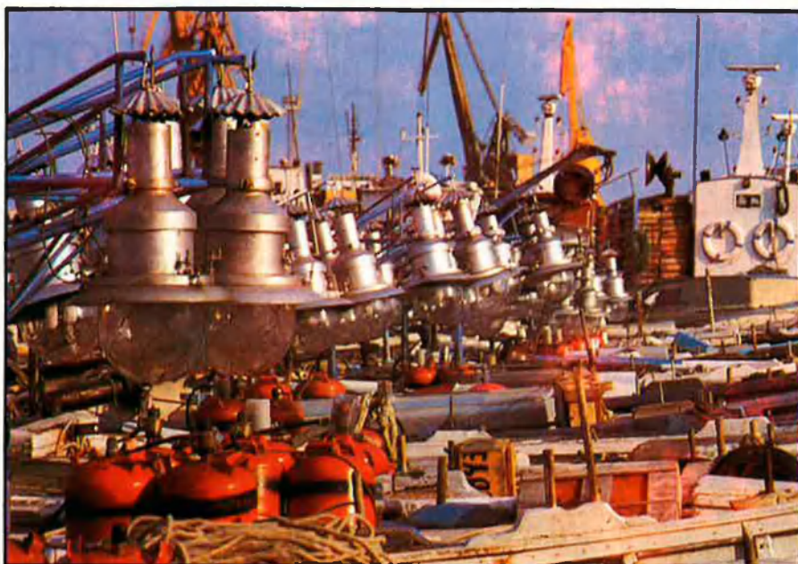
A l'Ametlla la pesca ha provocat l'enfrontament de famílies senceres.

Sobre la possibilitat de l'acord hi ha pronòstics per a tots els gustos. Els més