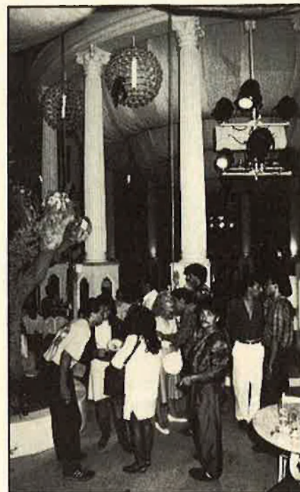
Enguany ha augmentat el volum de turistes.

Pel que fa als passatgers, l'evolució és semblant a la dels vols. L'any 1961 es registra un volum de 819.469 i s'i-