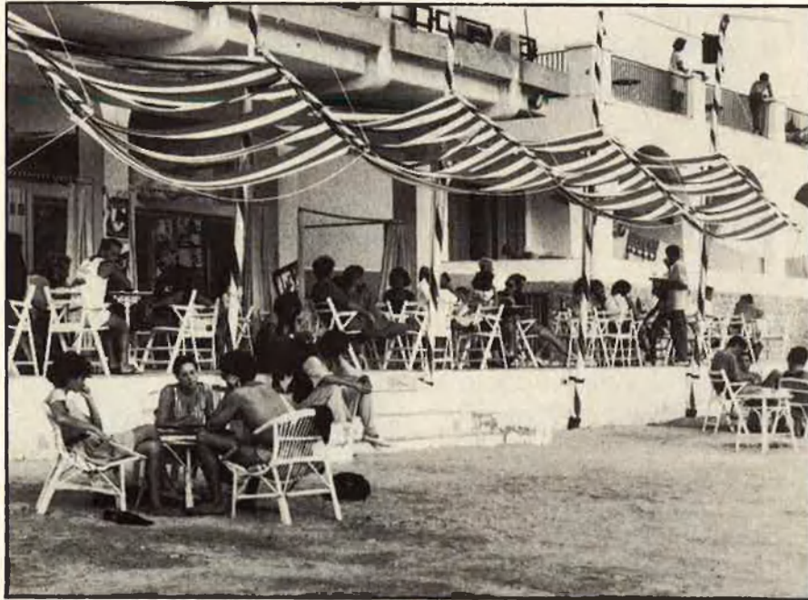
Un turisme jove i en ascens.

Un 64,5% té per costum allotjar-se a hotels, un 26% a apartaments, un 3,9% a xalets, i a cases d'amics n'hi ha un 2,6%. Dels que trien hotels, un 46,3% ho fan a establiments de 3 estrelles, als de 2, hi van un 21,6%, un 15% es queda amb el més modest d'una estrella i sols un 9,9% van a hostals. A hotels de gran categoria, n'hi