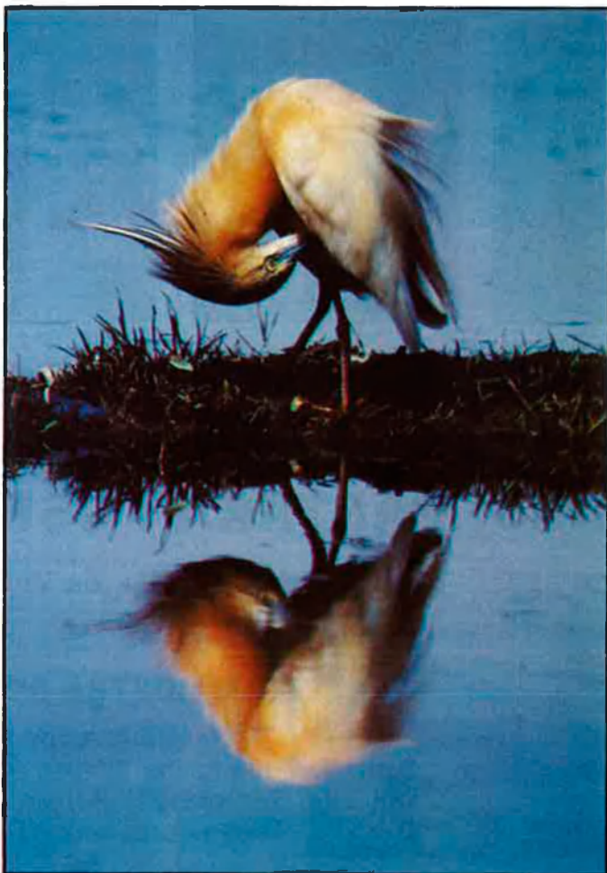
Dalt, 2n i 3r premis. Baix, 1r premi.

l'aigua d'una garsa rentant-se. Guanyava, per tant, la placidesa, l'animal elegant,