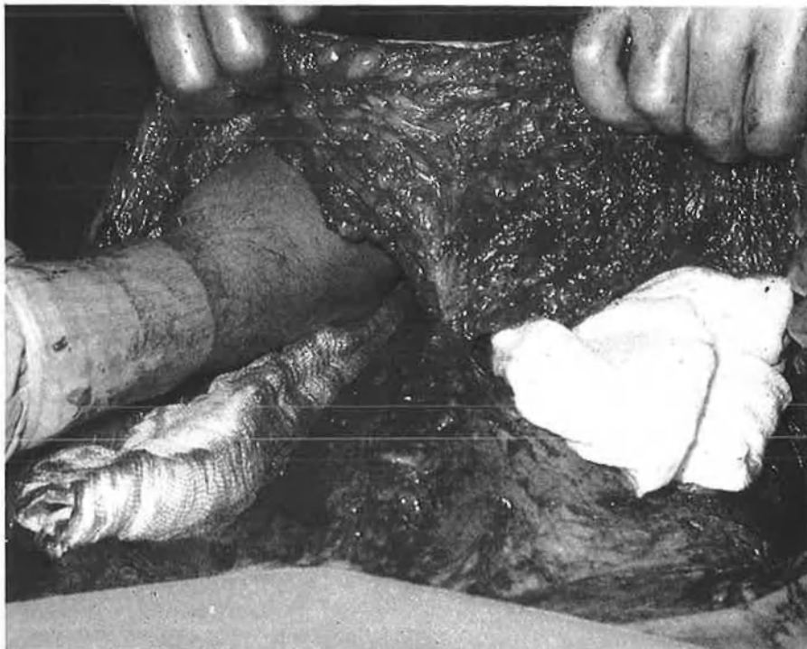
En la major part dels casos, la cicatriu no desapareix.

Tot i això, a diferència de la resta dels països europeus, ací no hi ha una relació psiquiatre-cirurgia; és a dir, els pacients no compleixen el cicle tan comú en altres països d'acudir primer al psiquiatre i que aquest els envie al cirurgian per a corregir, per exemple, les orelles de pàmpol, causa de freqüents depressions o de comportaments negatius. «Això passa —segons Vicent Miravet— perquè actualment, no hi ha una relació professional entre psiquiatres i cirurgians, quan l'aspecte físic en una societat que valora la imatge és causa de moltes depressions.» «El cirurgian plàstic ha de fer un poc de psicòleg perquè de vegades pacient i metge utilitzen verbs diferents. La cirurgia no fa miracles i perquè el pacient ho entenga fóra convenient l'ajuda d'un psiquiatre».