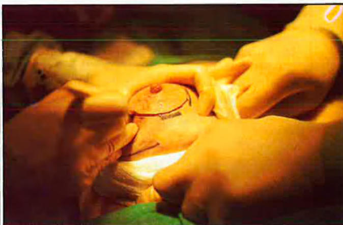
Dalt, xiquet operat amb la síndrome de Down. A l'esquerra, operació de la cara. A la dreta, operació dels pits

CANVIAR D'IMATGE PER MILIÓ I MIG DE PESSETES