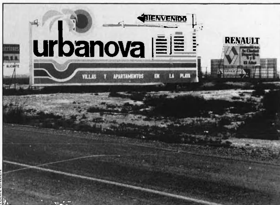
Urbanova, el poder dels diners.

Per tal d'aconseguir que el Mediterrani arribe a aquest poble de luxe, tan