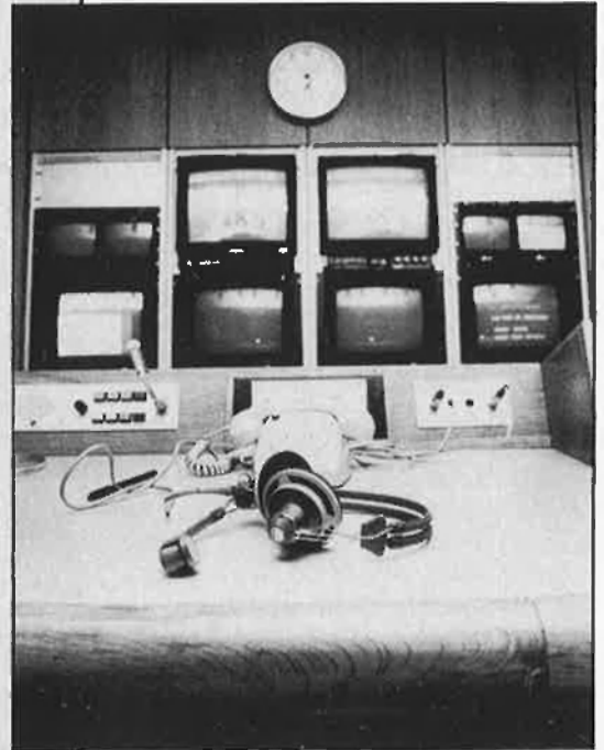
Televisió privada: a l'espera del Pla Tècnic.