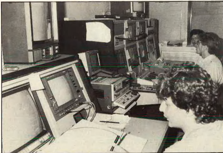
1989-90: dades per a la posada en marxa de les cadenes privades.

L'anterior ministre, Abel Caballero, en tenia un de preparat des del mes d'abril passat i l'anterior portaveu del govern, Javier Solana, s'havia atipat de dir que el Pla sortiria al mateix temps que la llei de la TV privada. Ningú no