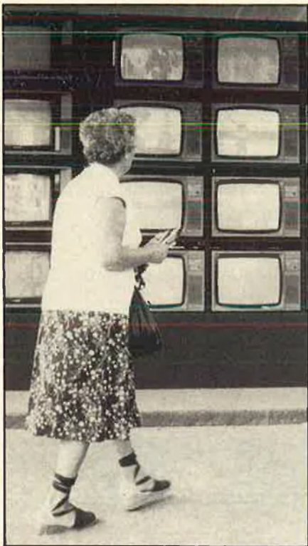
TV: batibull d'ones.

diotelevisió de Luxemburg (RTL), que té el 5% de les accions del Canal 10, constituí fa uns mesos una Societat d'Estudis de Televisió Independent amb les empreses espanyoles Tevisa, que posseeix catorze diaris regionals, i l'editorial Espasa Calpe del grup del Banc de Bilbao, per optar a un dels tres canals, si els estudis ho aconsellen. La RTL està presidida per Gaston Thorn, un personatge molt influent a la CEE, que estueja a la Costa Brava, i és un dels «monstres europeus en comunicació àudio-visual». La legislació espanyola només permet que el 25% dels accionistes d'una empresa de TV privada siguin estrangers. Fins i tot, el grup de La Vanguardia -Antena 3 ha mantingut contactes amb la productora britànica privada Granada Television, i el grup Zeta entaulà converses amb el grup francès Hachette.