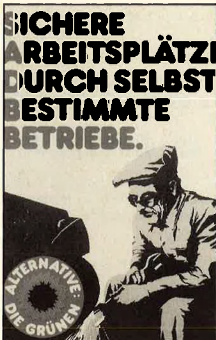
«Llocs de treball segurs a través d'empreses autogestionades».

Les causes de la crisi dels Verds, però, es remunten des del temps de la seva fundació. L'historiador Carl Amery veu en la fundació dels Verds l'aparició de dues forces: d'una banda, els grups contraculturals sorgits arran del 68, i, d'altra banda, iniciatives ciutadanes en què la principal preocupació era parar la destrucció del planeta i la recerca d'una forma per a consolidar aquesta protesta. Una fundació preci-