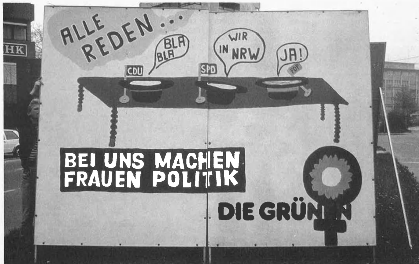
Tots parlen... «Amb nosaltres les dones fan política».

Un dels detonants d'aquesta crisi, encara que no la causa, s'ha produït entorn del debat parlamentari sobre la reforma del Codi Penal en les qüestions de delictes de violació: mentre que la majoria del partit i de dones apel·len per la màxima pena de tres