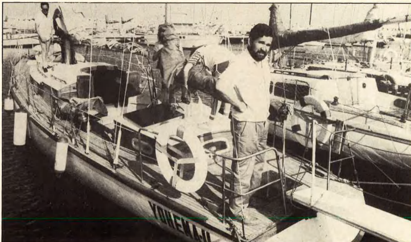
Joan Lerma, president de la Generalitat valenciana, vacances marineres.