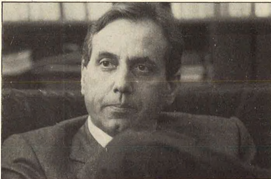
A Raimon Obiols li va el 'bricolage'.

Quan arriba el divendres, Joan Hortalà desa el vestit i la corbata a la residència barcelonina i marxa cap a Olot, on s'estarà fins dimarts. Els caps de setmana llargs són les úniques vacances que es pot permetre. Fora de la ciutat, i relativament oblidat el quefer polític, altres activitats omplen el seu lleure estiuenca. L'entorn del poble condiciona i la vida del pagès és una opció prou atractiva. Així, doncs, roba de feina per anar amb el tractor, donar de menjar al bestiar i, si és necessari, recollir bales de palla. D'altra banda, també cal treballar l'intel·lecte. Té una assignatura pendent amb els estudiants catalans d'Econòmiques: un llibre que es resisteix a ser acabat d'escriure.