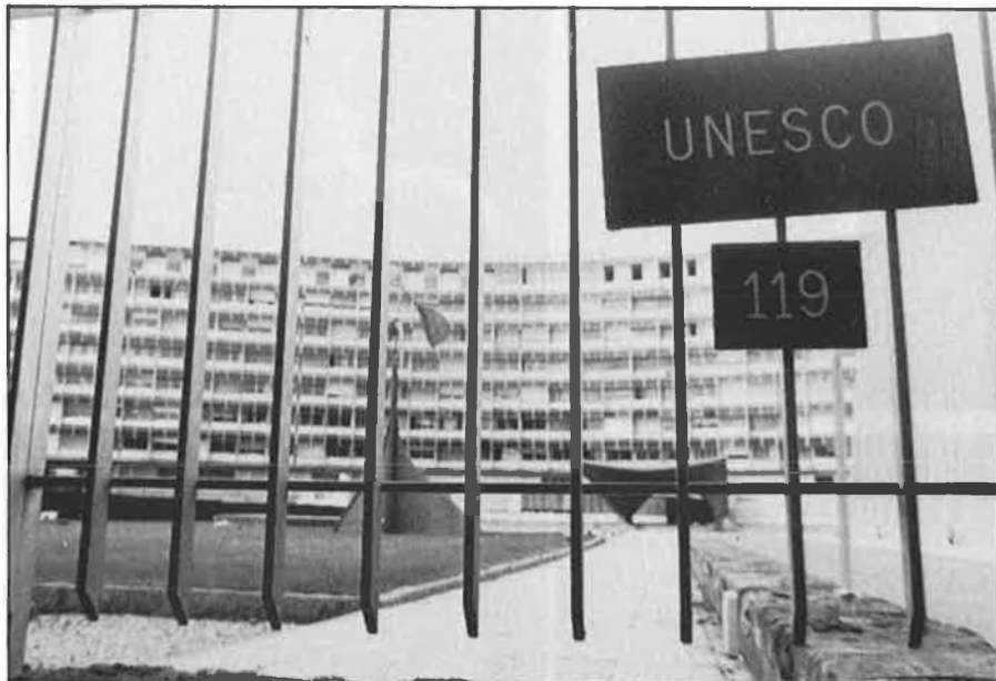
La UNESCO treballa també en el camp de la comunicació.

Ara, l'Associació Internacional d'Estudis i Recerques sobre la Infor-