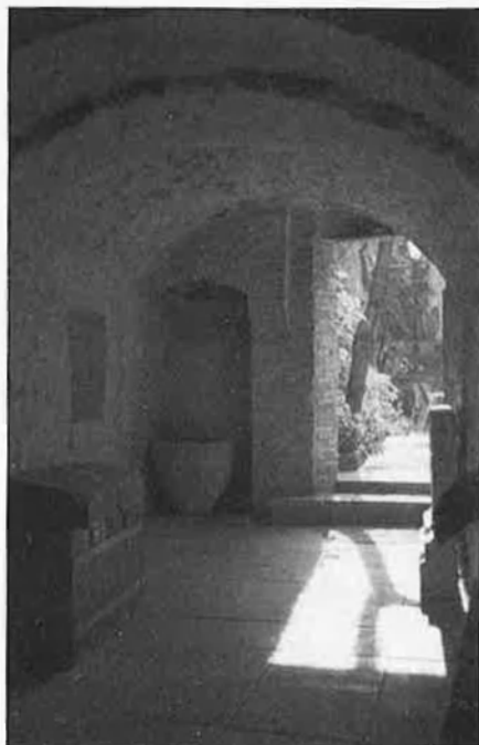
Una de les cases de la jueria de Girona.

El passiu del centre, que l'alcalde de Girona volgué calcular en uns 60 milions de pessetes, aviat aclaparà el centre Isaac el Cec, que li calgué posar un petit bar i restaurant per mirar de sobreviure. En nom de la cultura i de qui sap què més, les autoritats municipals es feren amb el control del centre. El mes de setembre vinent es complirà un any des que l'ajuntament gironí assumí directament la seva titularitat i prometé que, abans de finals del 1987, disposaria una fundació que garantís la direcció de totes les activitats i un pla global a tota la zona del call. No cal dir que l'any acabà i ja ha passat més