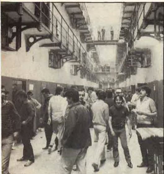
Galeria de la presó Model de Barcelona.

vell tolerable de delinqüència, i no per redimir ningú.