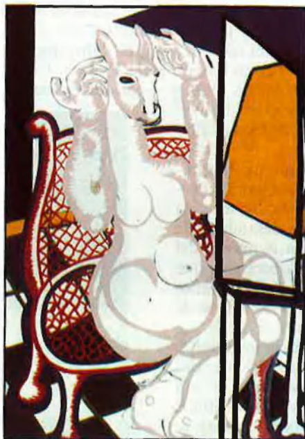
«Metamorfosi de pantera», 1981. Acrílic sobre llenç. Dalt, «Metamorfosi coqueta», 1981. Acrílic sobre llenç.

com que no puc, les pinte, pinte la dona i em descarregue, tot és una sublimació. La dona i... la mona. La mona, també l'he pintada, però no ho saben, i l'he pintada molt. No tenia no-via ni tenia res...».