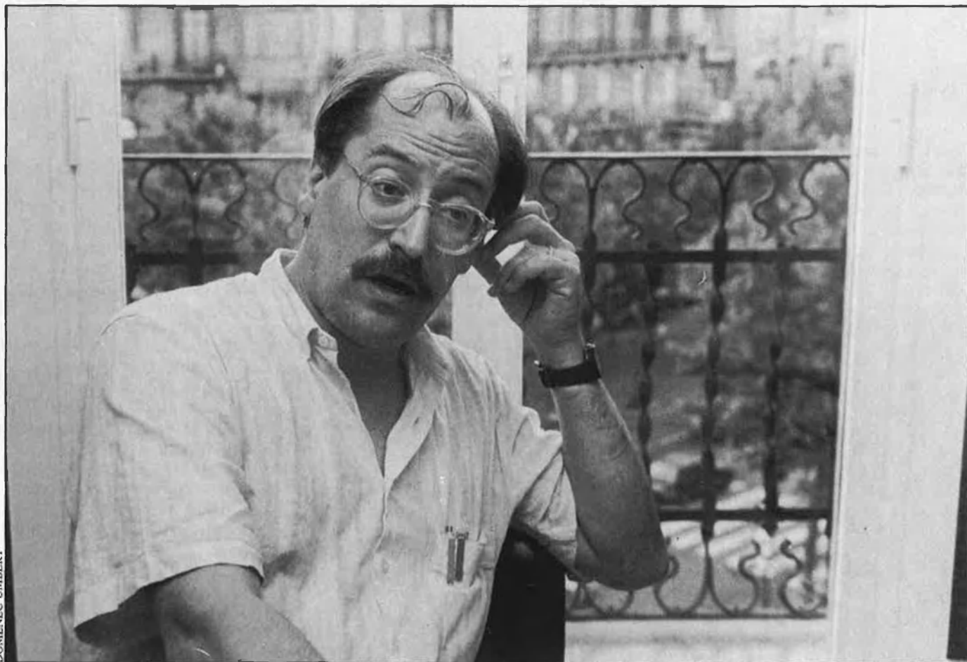
«Ara tinc una dèria bastant forta per les sectes.»

via fet el guió. Com que primer vaig fer el guió, que després desenvoluparia el director, he vist com s'anaven creant dues visions distintes... I, és clar, de les dues, la meua és la que més m'agrada.