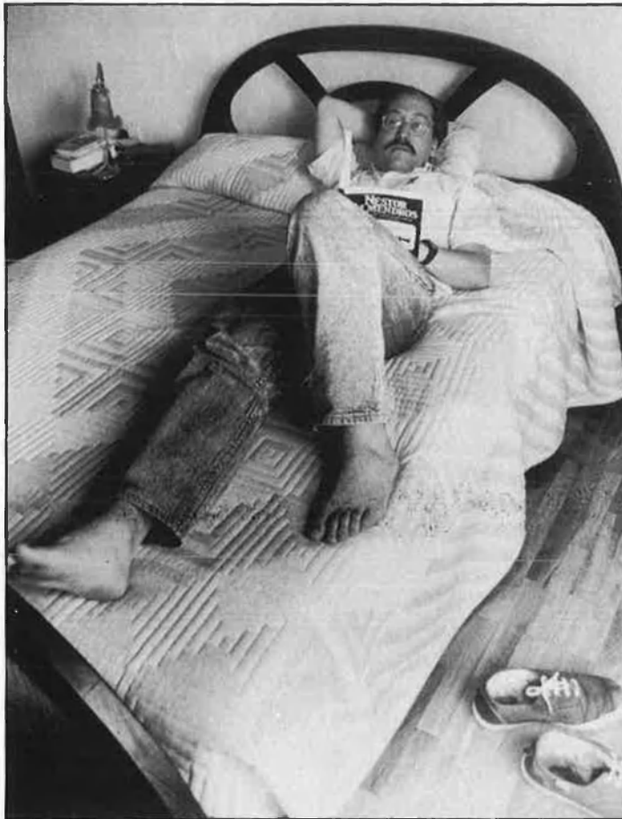
«La novel·la negra actual és més amarga que la d'abans.»

—En el 75 vaig escriure una novel·la per presentar-la a un concurs de policíaca, de «Los libros de la frontera». No vaig guanyar, perquè l'editorial va