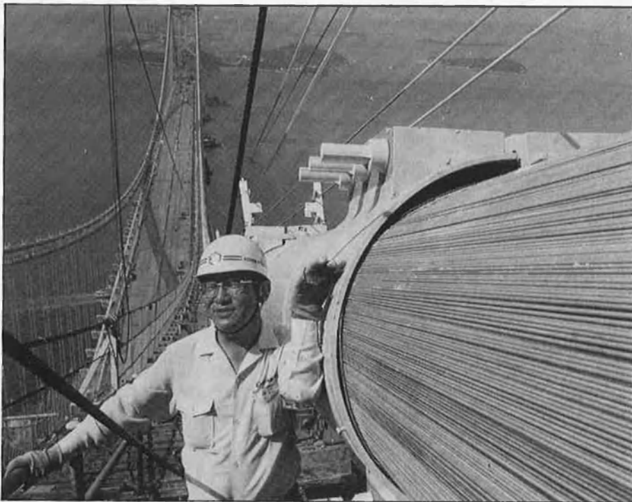
L'enginyeria japonesa és capdavantera en la construcció de grans obres.