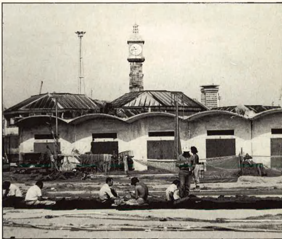
El litoral tradicional pot alterar-se bruscament amb nous ports esportius.

Com tampoc es contempla res en la Disposició Transitòria Tercera de la llei sobre l'anul·lació dels drets adquirits per particulars sobre la costa. Els registres de la propietat continuaran aco-