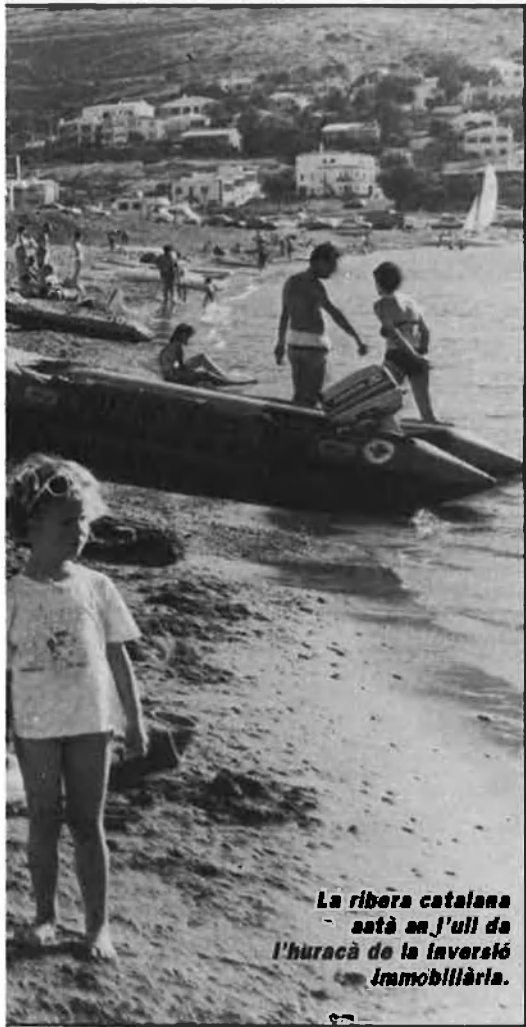
La ribera catalana està en l'ull de l'huracà de la inversió immobiliaria.

D'aquesta manera, un dels primers tours operators britànics, l'International Leisure, ha declarat el seu amor apassionat per la Costa Daurada i, malgrat les limitacions de la Llei de Costes a punt d'emissió, li augura una extraordinària perspectiva de desplega-