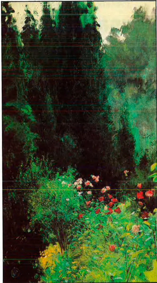
«Jardí prop de Grasse» (oli sobre tela).

— Vostè ha pintat personatges tan rellevants com el rei, el baró Von Thyssen. ¿Li ha resultat fàcil introduir-se en això que en diuen la jet?