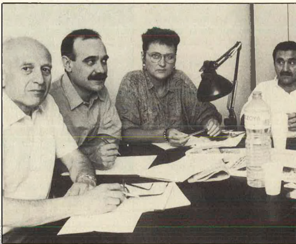
Sessió de treball de les entitats culturals més importants del nostre àmbit lingüístic.

El dissabte 2 de juliol, els càrrecs directius de les tres màximes entitats culturals del nostre àmbit lingüístic i cultural es reuniren a València en sessió de treball.