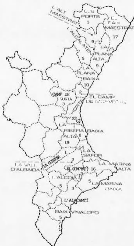
Mapa comarcal del nombre d'escoles que han iniciat l'ensenyament en valencià*