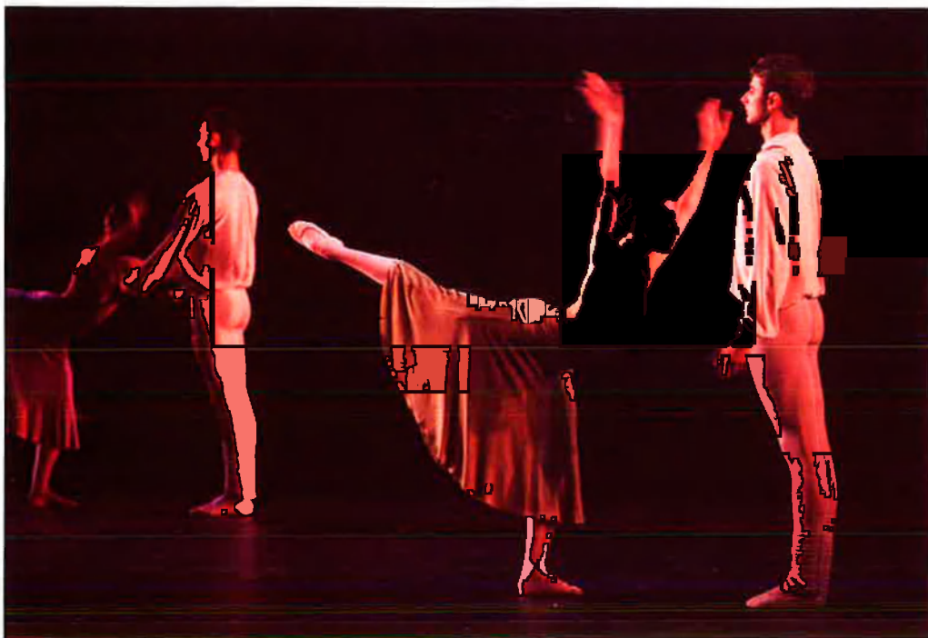
Nederlands Dans Theater, una companyia a mig camí entre el ballet clàssic i el modern.