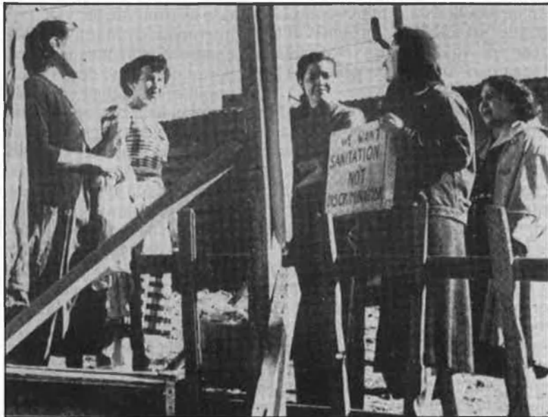
D'esquerra a dreta i de dalt a baix: «Ben Hur», «Drowning by numbers», «L'oeuvre au noir», «Crossfire» i «La sal de la tierra».

Per sortir de la presó i tornar a la feina, però, Dmytryk va delatar alguns dels seus companys de generació.