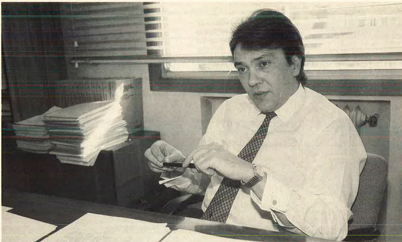
«La crítica neoconservadora de l'estat ha estat basada en l'eficiència i cal reconèixer que en part han tingut raó».