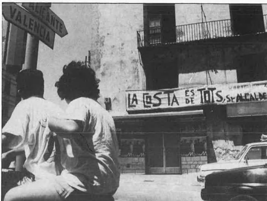
Hi ha hagut una demanda social contra la desprivatització del litoral.

Sense anar més lluny, l'avantprojecte reservava una franja d'un quilòmetre d'amplària en què es limitava la construcció «a aquells serveis que ne-