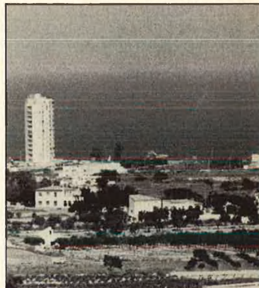
Hi ha hagut reaccions apocalíptiques.