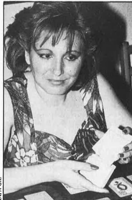
«Jo no trac esperits del cos».

—És una fraternitat, amb uns ensenyaments esotèrics i místics, dedicada a l'estudi i aprofundiment del camp esotèric.