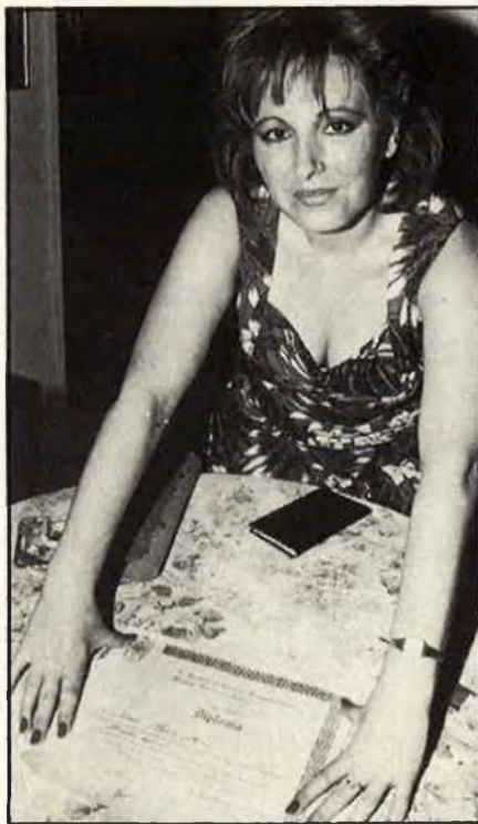
Thais: risc de riudes a la tardor.

—Anem a veure. En primer lloc, tal com jo veig la situació, hem travessat un període un poc crític, que tendeix a desaparèixer lentament. Veig empreses que sorgeixen, un apogeu molt important per a València. Veig una visita oficial d'algú de la cort. Veig canvis d'obstacles: petits problemes polítics