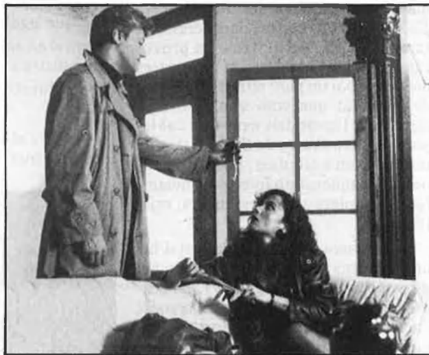
Dues de les pel·lícules que es projectaran al Festival: «Schloss Konigswald» i «L'amor és estrany».

goixa, de Bigas Luna, l'últim que va produir. El panorama d'exposicions es completa amb «Llums i ombres, crònica del film de Jaime Camino», que recull fotografies i objectes procedents del rodatge de l'últim film de Camino, que s'estrenarà la tardor que ve.