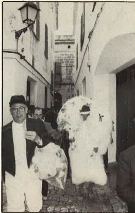
Caixer amb flabiol passejant pels carrers de Ciutadella.

El «dia d'es be» —diumenge anterior a les festes—, a les nou del matí surt la comitiva «d'es be», formada per la Junta de Cixers i un home amb un be al coll, l'home del be («s'homo d'es be»). Aquest home vesteix dues pells de be, una davant i una darrere, porta els peus i els braços nus, marcats amb creus d'almangre, igual que el front. Al cap hi du una aurèola, amb el signe de l'«Agnus Dei», i al front una corona com les dels cavalls. El be que trans-