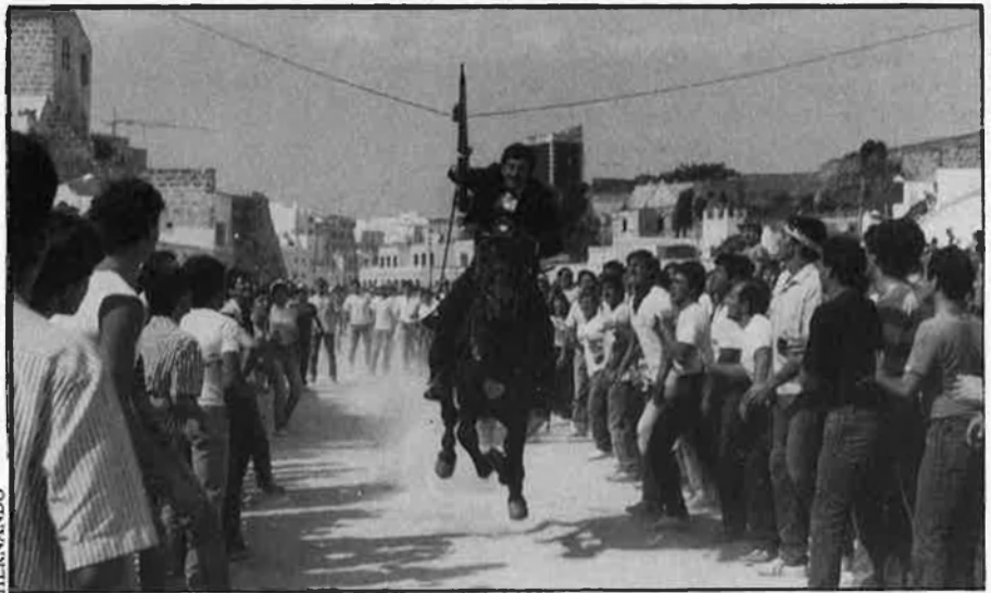
Els genets lluiten per endur-se l'anella amb una llança curta.

El cavall de Sant Joan, de sobte, és ben bé una criatura perfecta, i pren el galop, lliure, corre carrer avall, i allà on no hi ha carrer les cases s'aparten per obrir-li pas, com si fossin ben bé badocs dels qui omplen el Pla, la tarda de Sant Joan, per deixar córrer els genets que pugnen per endur-se l'entortilla, endevinar una anella de dalt al cavall estant, amb una llança curta, i guanyar una cullera de plata i potser el somriure d'una dama. El cavall de Sant Joan, arribat a l'escala de notes