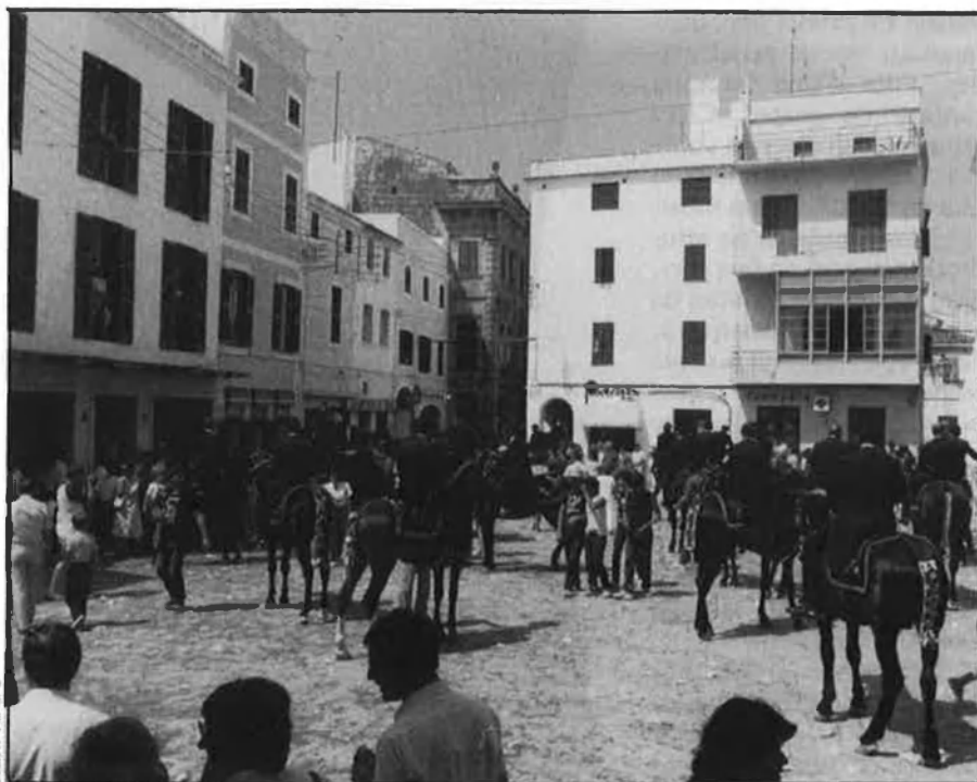
Els cavalls engarlandats esperen el començament de la cavalcada.

Hi era i encara hi és, tot això. Però avui es fa entre un núvol de gent. Molt pocs van mudats i amb capell de galleta, com solien, i molts porten robes es-