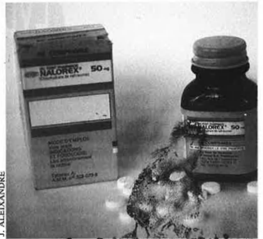
Naltrexona: el miracle antiheroïna.

La naltrexona és un potent antagonista que bloqueja les cèl·lules receptors d'opiacis del cervell i desplaça els agonistes anul·lant els efectes agradables i sedants produïts per l'heroïna. Segons els metges, aquest fàrmac pot ser emprat en tot tipus d'addiccions a opiacis i la seua funció terapèutica està encaminada a tractaments que eviten les freqüents recaigudes de toxicòmans que sincerament desitgen mantenir-se abstinents, tant en aquells que han fet una simple cura de desintoxicació, com en els que s'incorporen de nou a la societat, després d'una llarga estada en centres de rehabilitació o hospitals. De la mateixa manera, la naltrexona està recomanada en aquells casos en què es vol abandonar un programa de manteniment amb metadona. Aquest medicament tan sols pretén eliminar alguns problemes a l'addicte, però el mantenen enganxat, situació que no es repeteix amb la naltrexona.