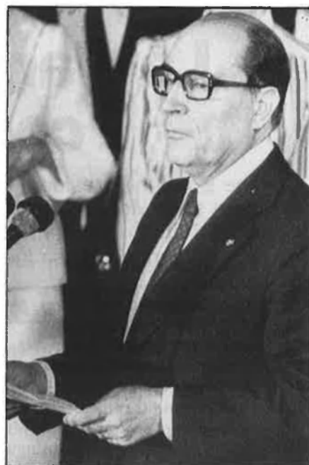
Mitterrand, per l'esquema alemany.

L'ex-president Giscard d'Estaing, que ha aprofitat aquestes eleccions per