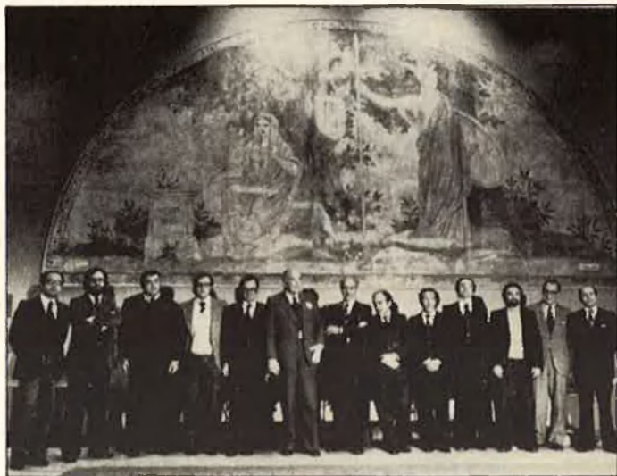
A l'esquerra, el president del Govern, Adolfo Suárez, assisteix a la presa de possessió de Josep Tarradellas com a President de la Generalitat. A la dreta, foto presa després de la reunió del primer Consell Executiu de la Generalitat restablerta.

tres possibilitats de triomf es veuen més clares que mai i per això em sembla que no som lluny del dia que caldrà explicar què ha succeït i succeeix amb la Comunitat dels Benedictins de Montserrat, perquè, ens agradi o no, hem de reconèixer que les seves activitats polítiques tenen una significació, quan tots estarem d'acord a pensar que la seva missió hauria de ser tota una altra.»