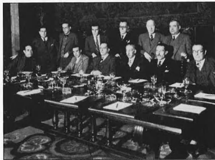
Govern de la Generalitat constituït el 17 de desembre de 1936, sota la Presidència de Companys, amb Josep Tarradellas com a primer conseller, encarregat també de la Conselleria de Finances.

«He manifestat ben sovint que dissortadament a molts joves de la generació de la postguerra el pensament polític i les actuacions d'Amadeu Hurtado i principalment de Claudi Ametlla els han fet més dany que la propaganda franquista. Aquesta tenia ben poca influència, mentre que l'acció