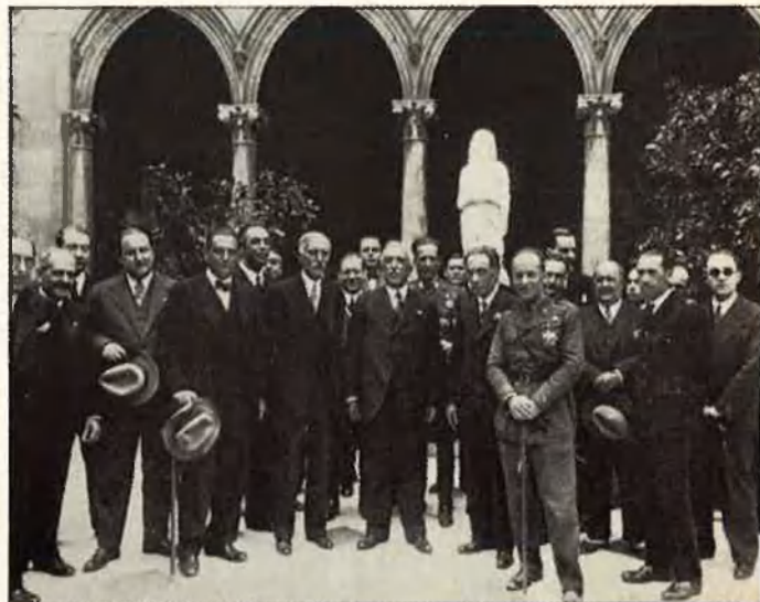
A l'esquerra, Centre Autonomista de Dependents del Comerç i de la indústria. A la dreta, Niceto Alcalà Zamora acompanyat del president Macià, al Pati dels Tarongers de la Generalitat. Tarradellas apareix a la dreta, el segon darrere el capità general de Catalunya.