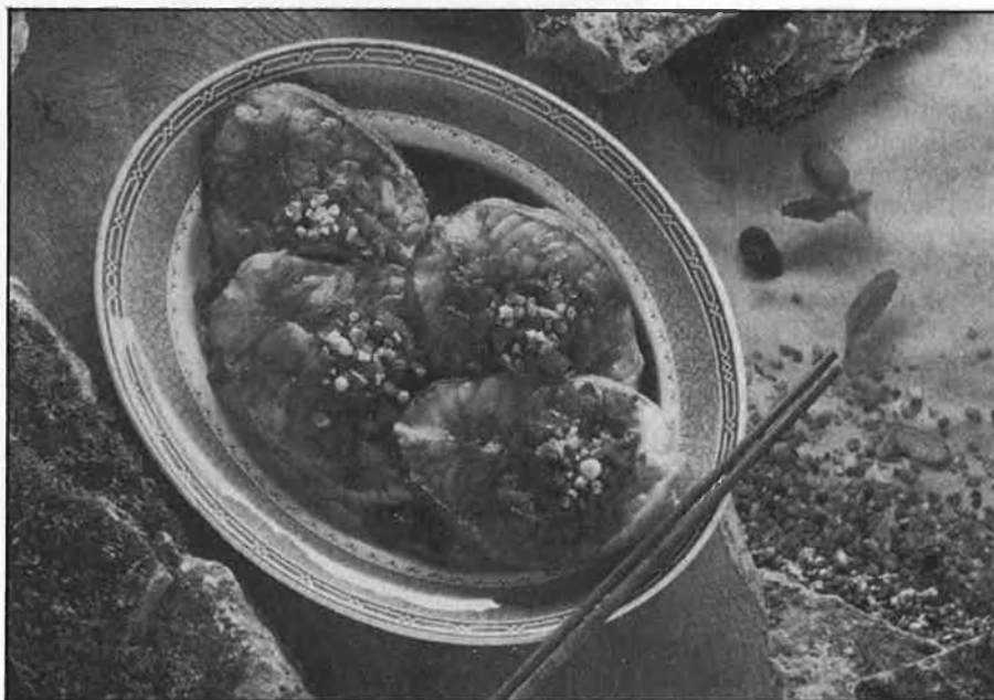
L'estiu és una de les temporades menys propícies per a treballar la gastronomia.

—¿Hi ha alguna mena de pla conjunt de cara a preparar els plats i cartes de l'estiu?