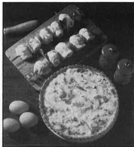
Els ous crus poden convertir-se en un niu de gèrmens.

aconsellant fer plats amb avellana. Quan se'ns demana coses d'aquestes puntuals, no hi ha cap inconvenient a col·laborar. Però una altra cosa és que diguéssim «ara tots farem això». Cada casa és un món i cadascú és cadascú, i com que hi ha el factor de la competència, tothom s'ha d'espavilar si pot trobar el plat més curiós que l'altre. Aquí sí que hi ha llibertat absoluta i en això no podem incidir gens, perquè seria anar contra nosaltres mateixos.