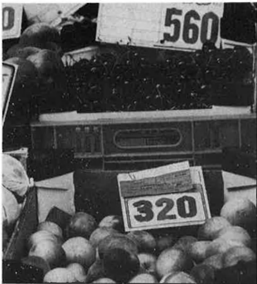
Fruita del temps, el metabolisme l'agraeix.