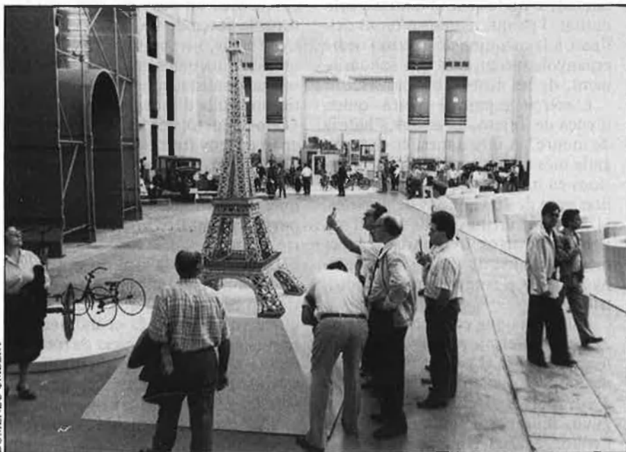
Preparació de l'exposició Cent anys de Fira.

Una cosa, però, és innegable: 1992 és ja una data mítica, el masclet que ha despertat Barcelona d'una migdiada, ni llarga ni curta, i li ha fet tornar a creure's que sempre ha estat una gran