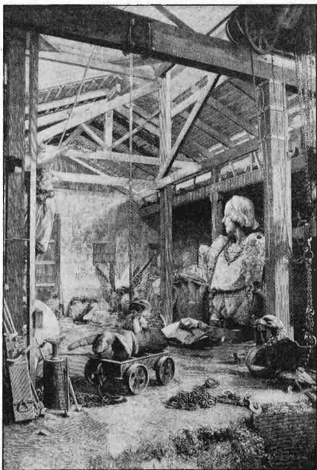
Dalt, el Palau de l'Agricultura. Baix, un monument de la construcció de l'estàtua de Colom.

allò que se'n diu gent de món. Fou una exposició discreta, si la comparem amb les de París (1878 i 10 milions de visitants), Londres o Viena. Els expositors, tret dels francesos, no van ser tampoc massa esplèndids a l'hora de mostrar els seus productes. Però en fi, quatre països de quatre continents (d'Oceania no hi va acudir ningú) plantaren la seva barraca al Parc de la Ciutadella, pertot arreu es parlà de Bar-