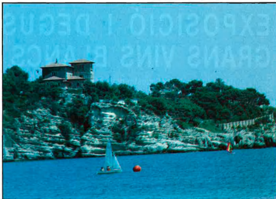
Dalt. La família reial, hostes estuencs de Marivent. Baix, Marivent va ser cedit als llavors prínceps d'Espanya, l'any 1983.