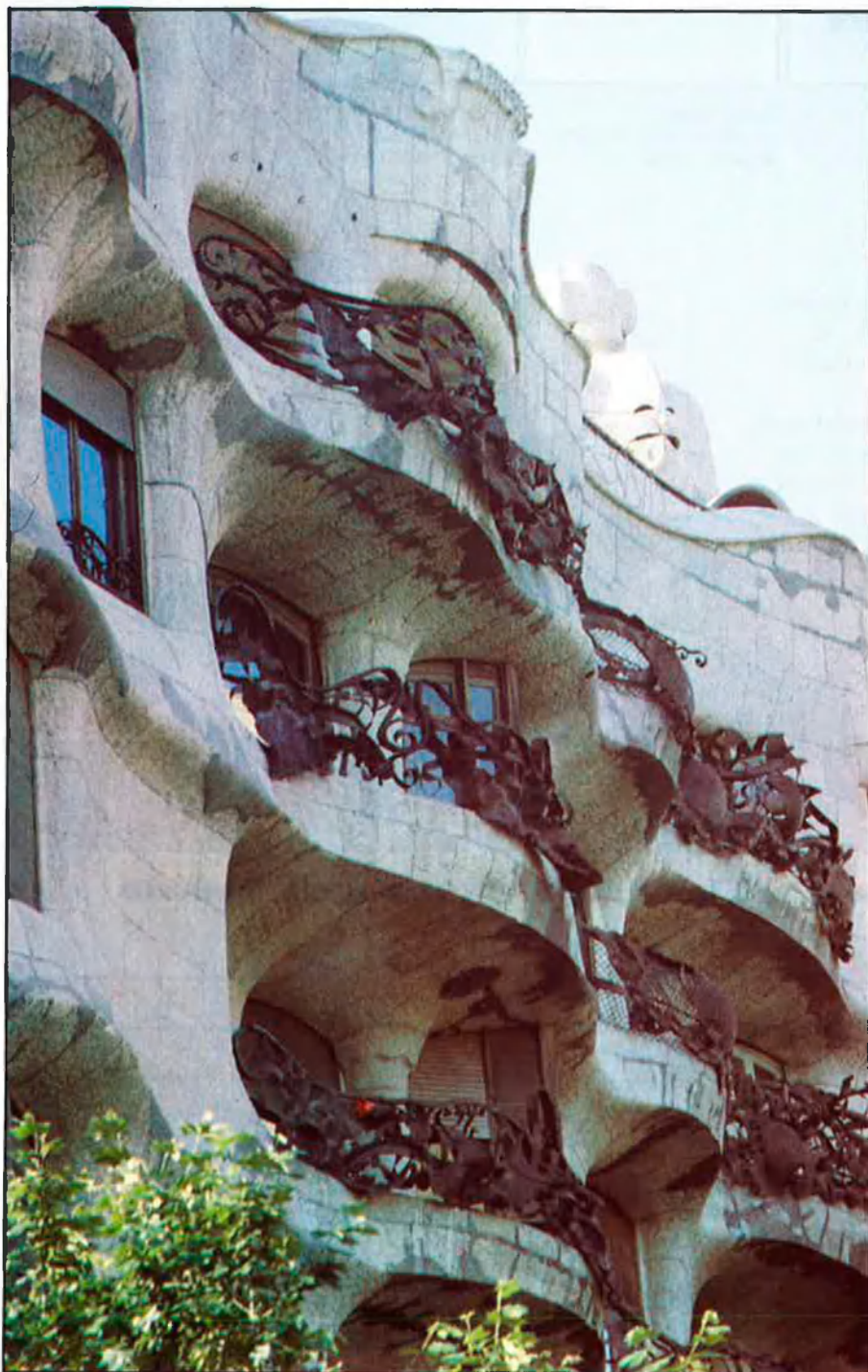
La Pedrera. Casa d'habitatges on Gaudí mostrà el seu domini de la tècnica creant una complexíssima estructura de pedra aparent (1905-10).

Les Fundacions i Obres Socials de les Caixes d'estalvi són una cosa molt normal en els temps que corren. La Caixa de Catalunya inicia ara una etapa d'oferta cultural als ciutadans de Barcelona i de fora, restaurant la Pedrera amb una inversió inicial de 120 milions de pessetes més una subvenció de l'ajuntament de 53 milions. De moment els ciutadans ja poden observar la neteja de la façana que s'ha fet durant sis setmanes. Ara ve la faceta del sanejament, que és la que portarà més feina i durarà més temps abans no vegem el new look de l'edifici.